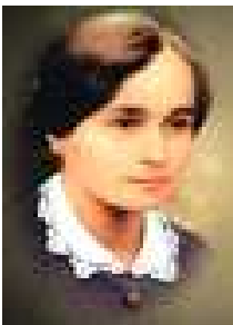
Apostołka kultu Najświętszego Serca Pana Jezusa oraz Jego Intronizacji